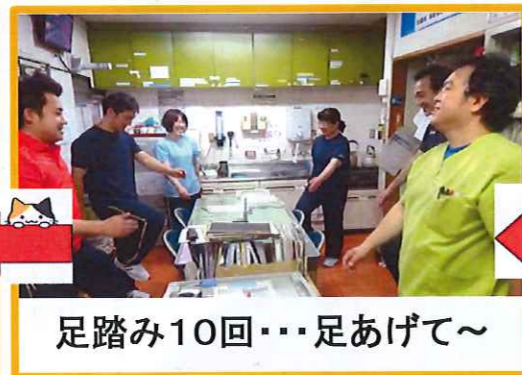
足踏み10回…足あげて〜