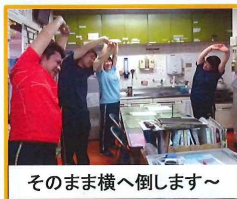
そのまま横へ倒します〜