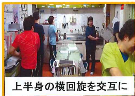
上半身の横回旋を交互に