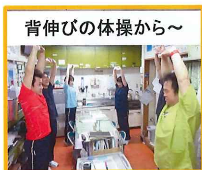
背伸びの体操から〜