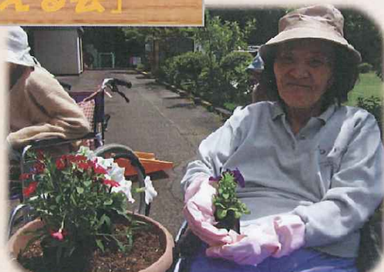
力仕事は男性のご利用者が大活躍