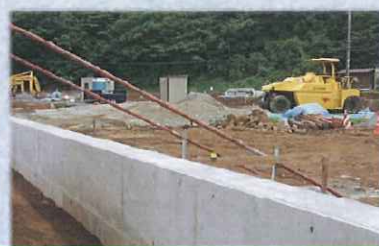
暑い中工事は始まっています

去る7月11日に行われた参議院選挙にて、老人福祉施設の代表者も二期目の当選が決まりました。前回、初めて老人福祉の代表を国会へ送った事で、全国特養待機者40万人！という事態によりやがて国が動いてくれました。