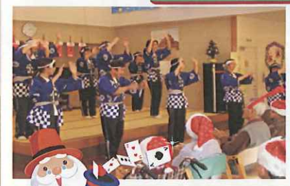
デイサービス「カンカン娘♡」