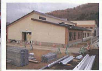
(上)奥の二階建て部分が養護老人ホーム、手前右の平屋建てが特養です。

前々号よりお知らせしている、特別養護老人ホームと養護老人ホームの新築工事の様子と施設名決定のご報告です。これから時代が移り変わっていく中で、寿康会が平成の時代に、職員皆で力を合わせて築いた施設という事で、「平成の杜（へいせいのもり）」と理事長が命名しました。これから「平成の杜」を宜しくお願い致します。！