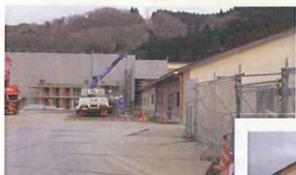
(下)西側より見た特養棟