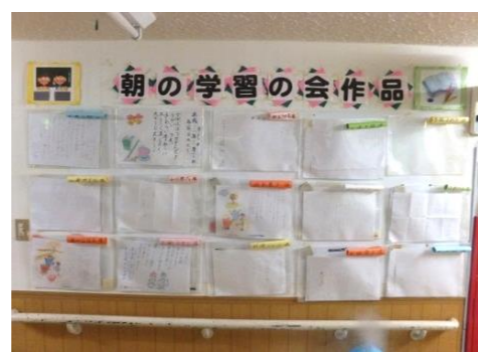
日頃の学習の成果……？