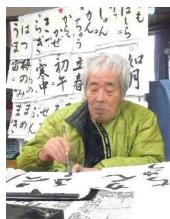
月2回習字の先生に指導していただいています。