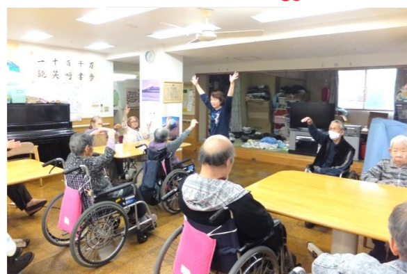
余暇担当の職員と、元気一杯健康体操